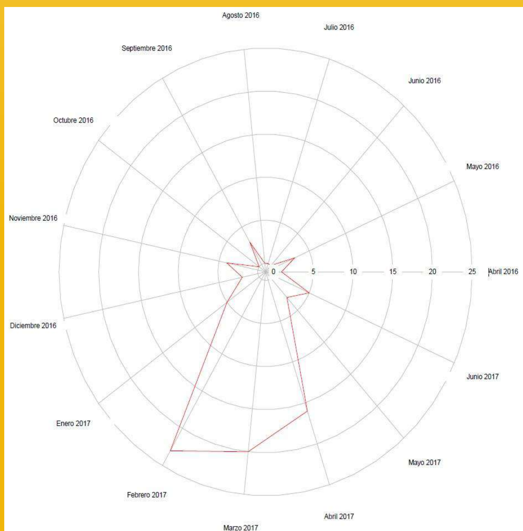
Figura 2 (izquierda): Gráfico radar que muestra la temporalidad de las aves impactadas por colisión con vehículos en el área de estudio entre abril de 2016 y junio de 2017.

Registramos 86 carcasas de rapaces, pertenecientes a 5 familias y 9 especies. Tyto alba fue la especie con mayor número de impactos, y una mortalidad estimada de 3,96 ind.km -1 .año -1 . Los registros de impactos se concentraron principalmente entre los meses de febrero, marzo y abril de 2017 y en total se generaron 8 puntos calientes que incluyeron el 38% de los impactos. Las aves tuvieron un 38% más de probabilidades de impactar con vehículos en zonas donde las carreteras son rectas que donde las carreteras presentaron curvas. Es probable que las colisiones, especialmente de Tyto alba , se deba a tres factores que podrían actuar conjuntamente: la alta densidad poblacional en el área, la facilidad de encontrar presas en los bordes de la carretera y la atracción de estas hacia las luces, especialmente en temporada de cría. Por su parte la mortandad de rapaces diurnas como Milvago chimango estarían asociado a sus hábitos carroñeros y su condición de volantones. Aunque se podría sostener que el número de lechuzas colisionadas es bajo, sólo consideramos el 22,4% del tramo en concesión, en un estudio de poco más de un año.