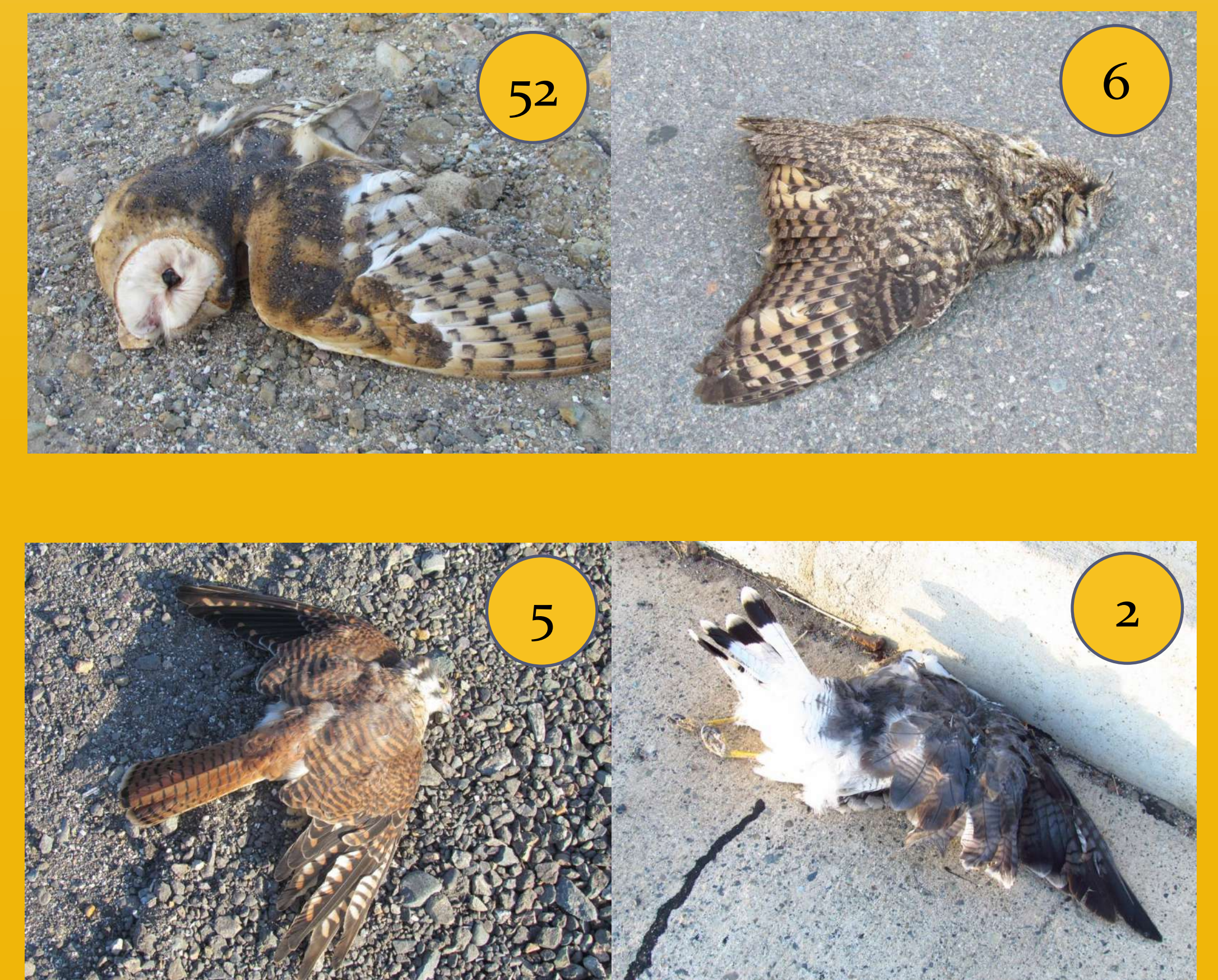
Figura 4: Ejemplos de especies de rapaces diurnas y nocturnas y número de ejemplares muertos registrados durante el presente estudio. Arriba: Lechuza y Tucúquere. Abajo: Cernicalo y Aguilucho, respectivamente.