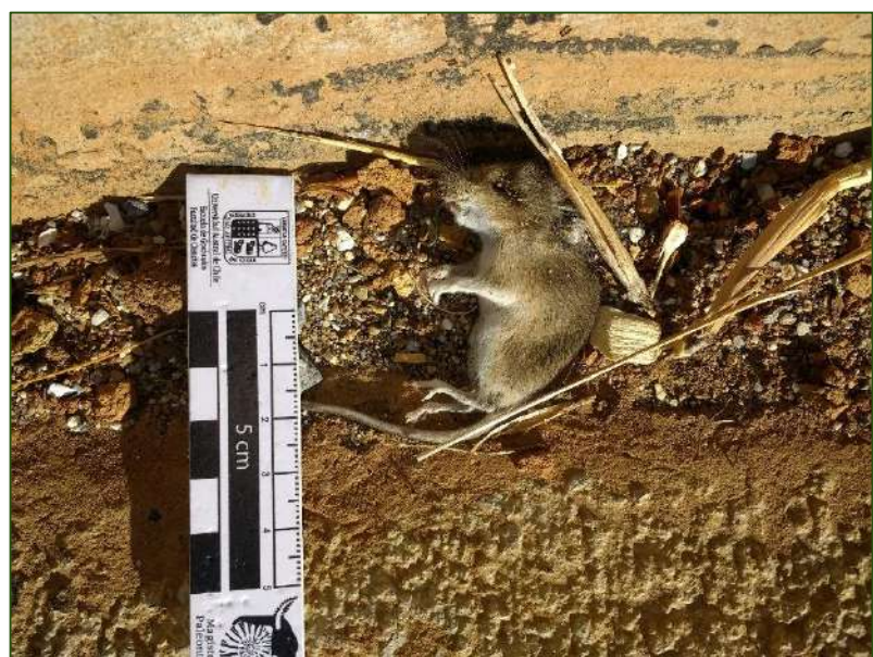
Figura 2. Fotografías de dos especies atropelladas en el sitio de estudio. A la izquierda S. barbatus y a la derecha Olygorizomys longicaudatus .